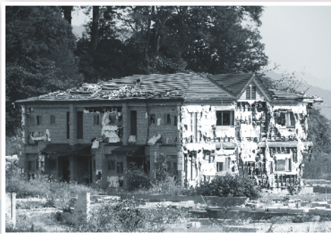
岩手縣災區一隅，從樓房頂得見洪水的水位有多高！