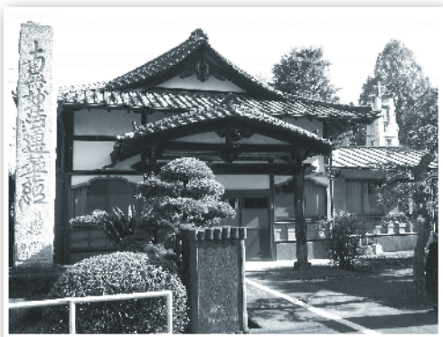
麻瘋病療養院內一隅，是任何宗教人仕參拜佛的地方。

融合就要「捨我」，積極而論就是處處為人為己留有空間，消極而言就是待人處事要保持距離，衝突自然會減少，以致真心交流的機會亦隨之被扼殺！日本近十年成功自殺的人每年逾三萬人以上，這些數字正反映國民內心的實況，然而，更可怕的事就是他們已接受這個實況，並且在不得已時已作好準備踏上不歸路！